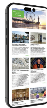
4. Digitale nieuwsbrief

Aanleverspecificaties: één rechte-vrije foto (liggend, JPEG) zonder tekst en logo's in het beeld, tekst (maximaal 100 woorden) en URL van de detailpagina.