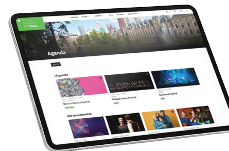
3. Agenda-item uitgelicht